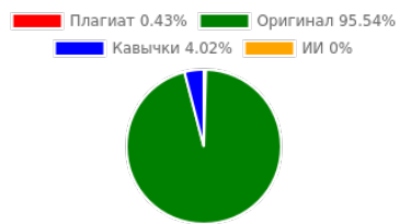
Диаграмма соотношения частей: